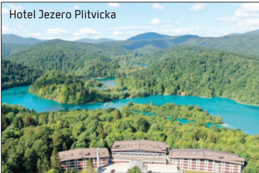
Hotel Jezero Plitvicka