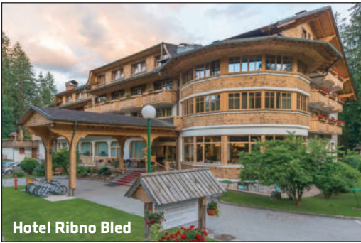
Hotel Ribno Bled