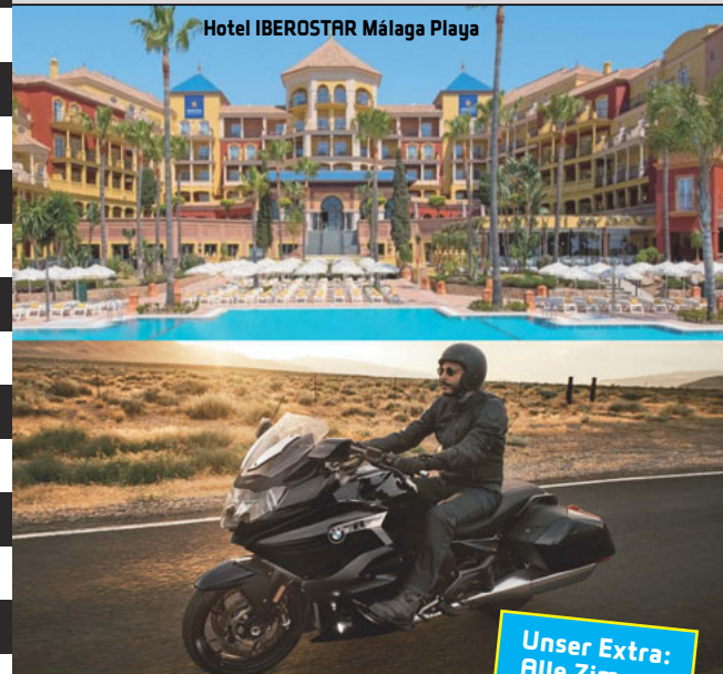
Hotel IBEROSTAR Málaga Playa

Anmeldung bitte bei uns im Geschäft abgeben